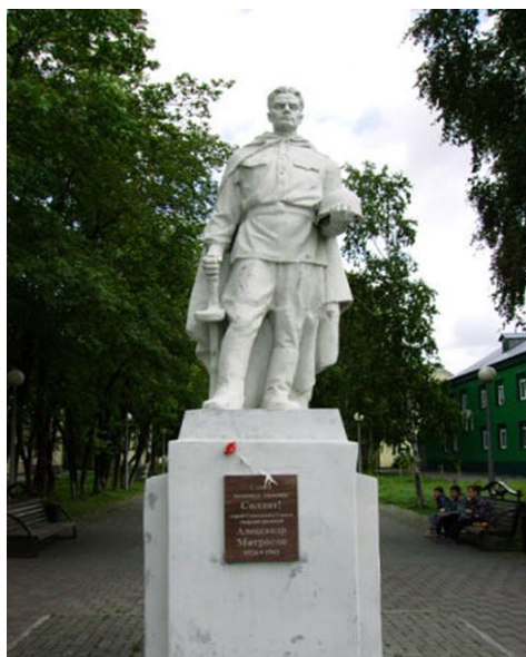
Современный вид памятника, 2014 г