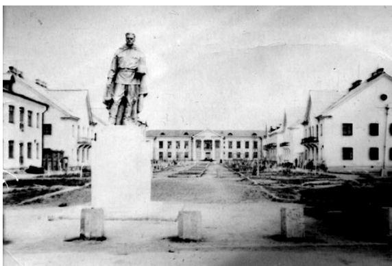
Конец 1950-х годов