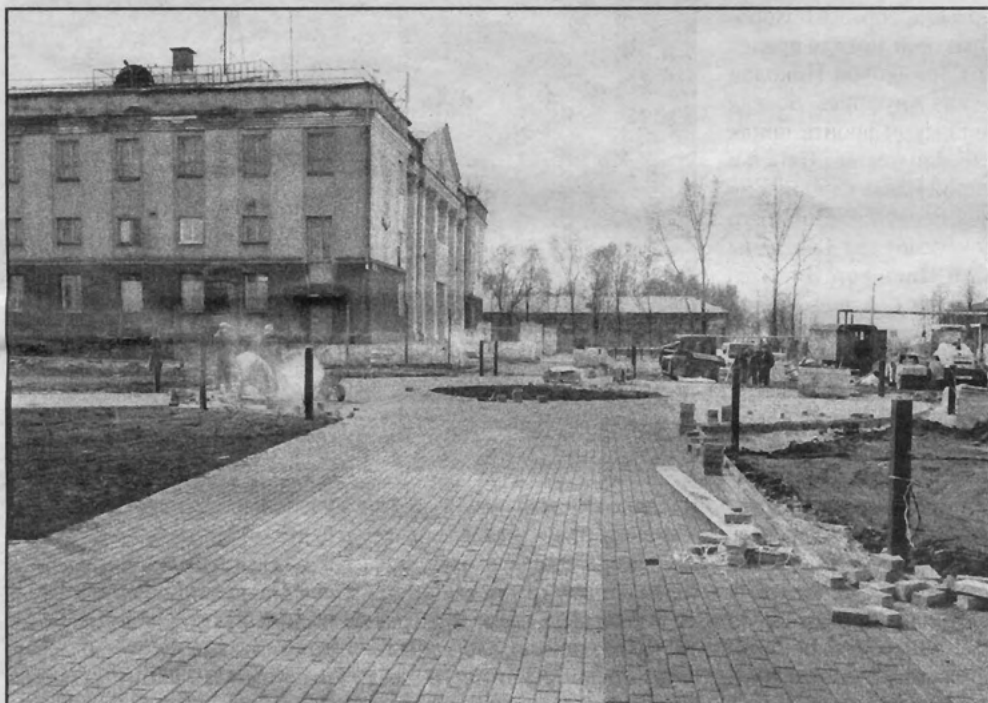
Перед ДК площадка преобразуется.

культуры. В эти дни он заполнен визгом пил-«болгарок», кромсающих бордюрные бруски, поребрики для укладки в местах рельефных углов, полукружий - «карманов» для 25 парковых скамеек. Урчат грейдеры, сверкают тут и там огни электрогазосварки.