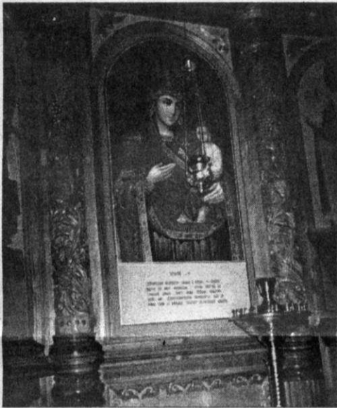
Икона Божьей Матери «Скоропослушница» из главного иконостаса.

Дом настоятеля на храмовом подворье - еще один нонсенс для Киселевска. Да и только ли для него? Почти все приходские священники живут за пределами церковных огород. А тут - особняк в старинном стиле, органично вписанный в общую кар-