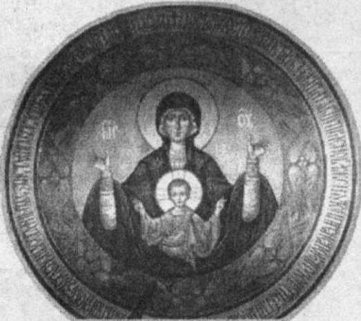
«Знаменье Божьей Матери» (фрагмент росписи купола в трапезной храма).