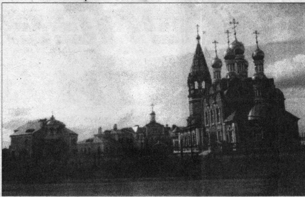
Общий вид храмового комплекса (вид с юго-востока). Слева - дом настоятеля.

В конце прошлой осени в Кемерове проходил семинар с участием видных деятелей Русской православной церкви. В один из