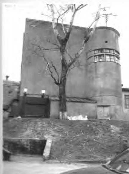
▲ Вид з сторони драматического театру