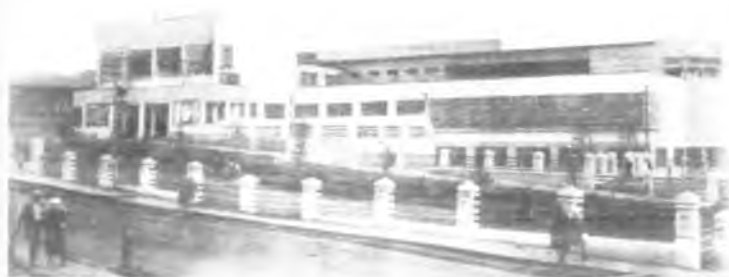
▲ Кинотеатр им. Р. И. Зіше Фото середини 1930-х рр.