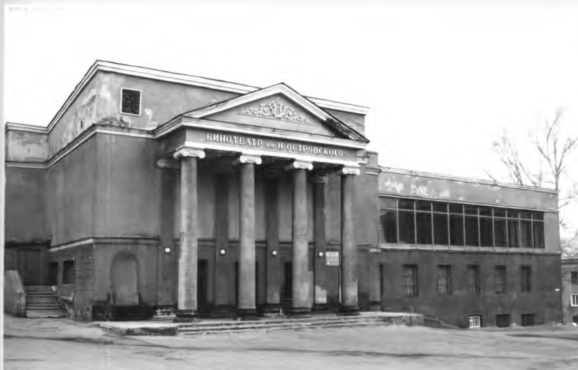
▲ Кинотеатр имени Н. Островского. 1932