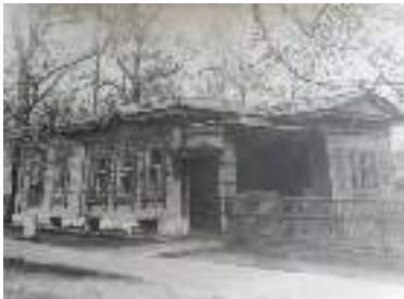
Дом купца Скуе

Из фонда архивного отдела администрации Мариинского муниципального района, материал подготовила Татьяна ШАФРАНОВА.