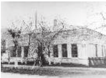
Дом купца Евсивича