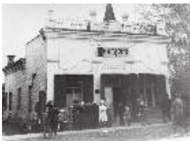
Дома купца Полуденцева