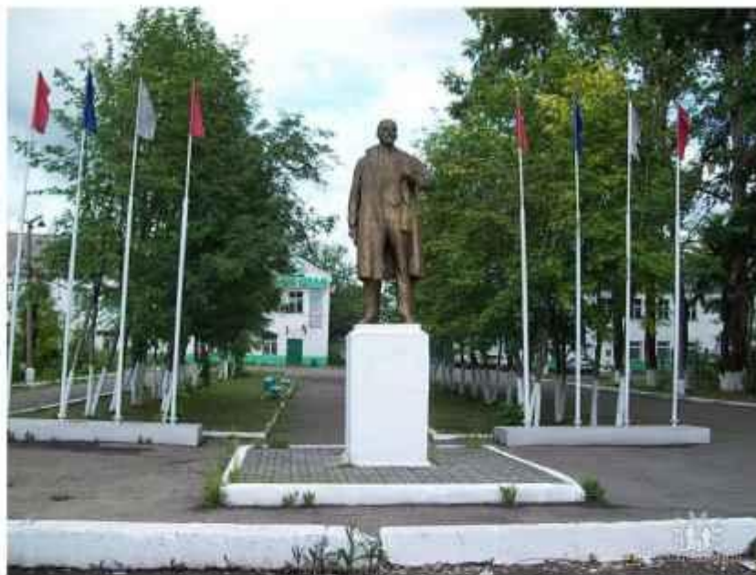
Современный вид памятника В.И. Ленину

По ул. Мира, напротив входа в химико-фармацевтический завод «Асфарма» стоит ещё один памятник В.И. Ленину. Работники завода ухаживают за ним, но, к сожалению, ни даты постройки, ни автора выяснить не удалось. Существует и в настоящее время. (Приложение 12)