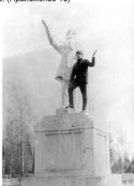
Памятник А.С. Пушкину, 1967 год

В пос. Мишиха в 1950-60-х годах находился памятник А.С. Пушкину, в настоящее время не сохранился. К сожалению ни даты постройки, ни автора, ни время демонтажа выяснить не удалось. (Приложение 13)