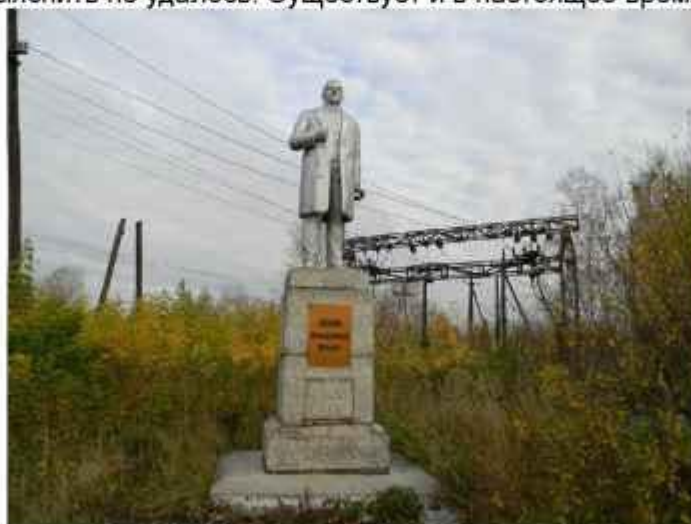
Современный вид памятника В.И. Ленину

Скульптура удачно установлена в центре сквера в 1970 году. К сожалению ни даты постройки, ни автора выяснить не удалось. Существует и в настоящее время. (Приложение 11)