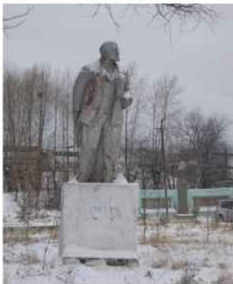
Памятник В.И. Ленину, 2009 год

На территории шахты 9-15, потом переименованную в шахту «Анжерская» находился памятник В.И. Ленину. К сожалению ни даты постройки, ни автора выяснить не удалось. Данный памятник и сейчас стоит на том же месте. (Приложение 10)