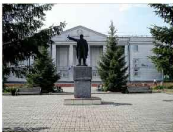
Современный вид памятника