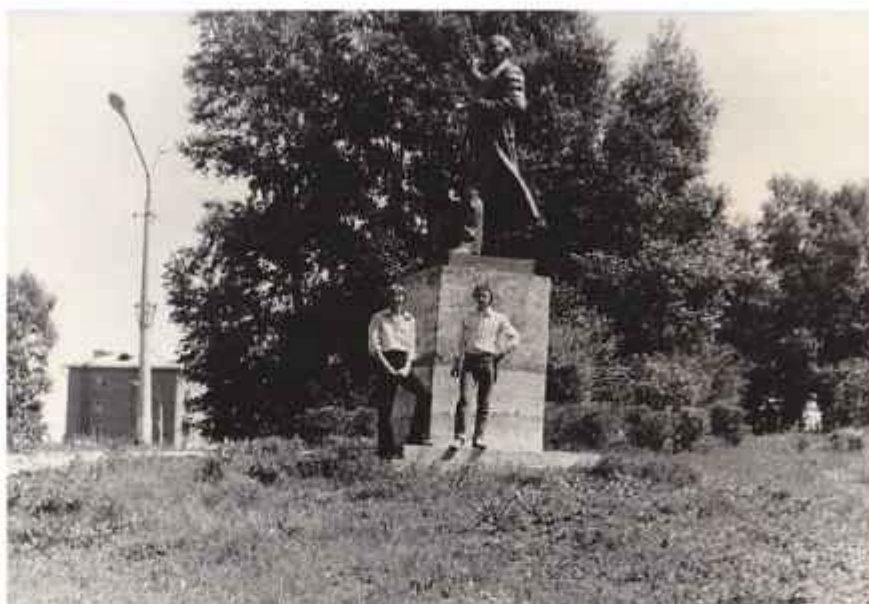
Памятник В.И.Ленину около кинотеатра «Радуга», 1978 г

На улице Ю. Гагарина напротив кинотеатра «Радуга» в 1970-годах находился памятник В.И. Ленину, в настоящее время не сохранился. К сожалению ни даты постройки, ни время демонтажа выяснить не удалось. (Приложение 8)