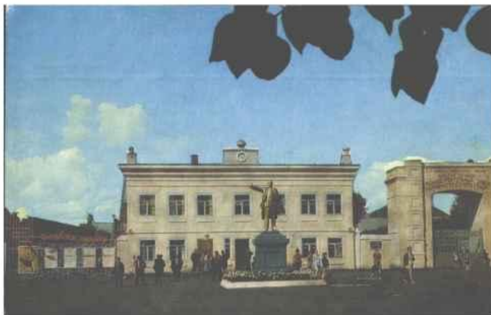
Памятник В.И. Ленину площади у машиностроительного завода , 1960-е годы

На площади у машиностроительного завода по ул. Войкова, д. 6а, располагался памятник В.И. Ленину, в настоящее время не сохранился. К сожалению ни даты постройки, ни автора, ни время демонтажа выяснить не удалось. (Приложение 9)