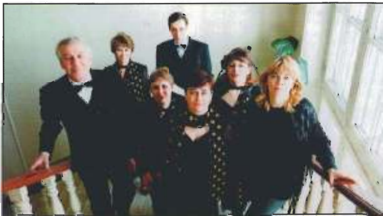
Вокальный ансамбль педагогов - лауреат областного фестиваля