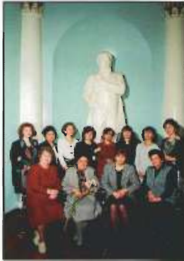
Преподаватели фортепианного отделения