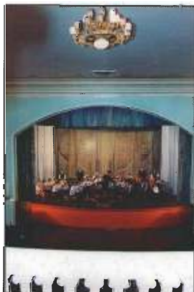
Концерт оркестра русских народных инструментов