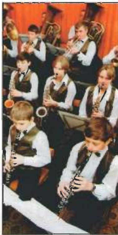
Дарил нам радость музыки оркестр духовой