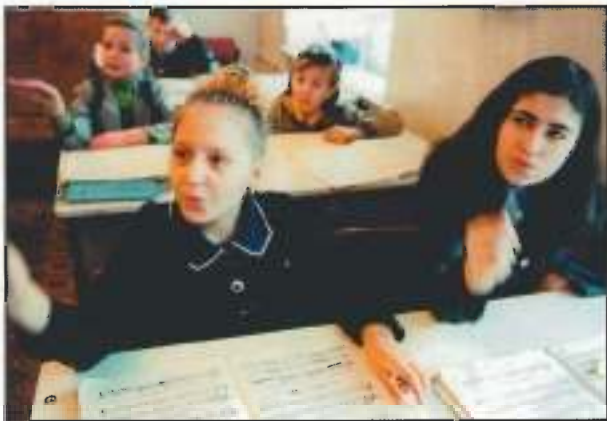
До, ре, ми...