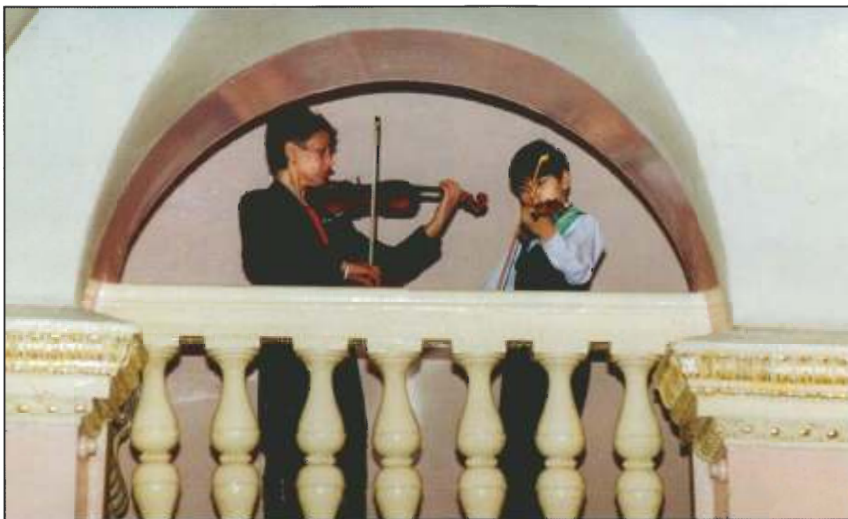
И льется музыка, и длится волшебство...