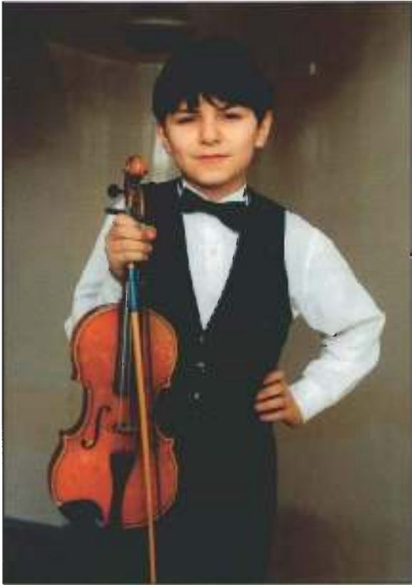
Скрипач Арнольд Авдалян