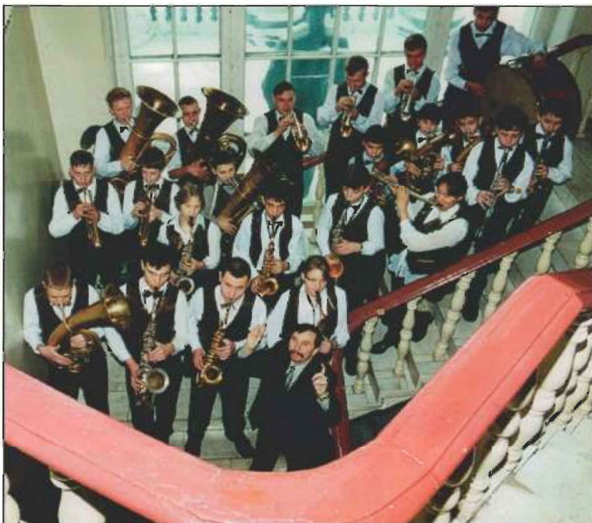
Духовой оркестр школы