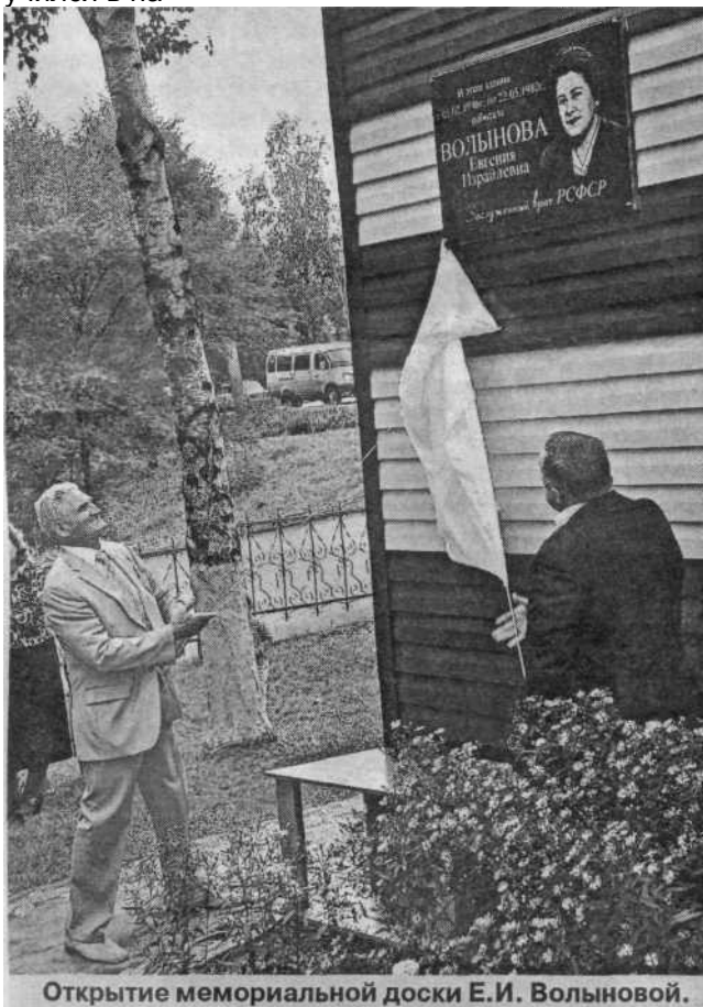
Открытие мемориальной доски Е.И. Волыновой.