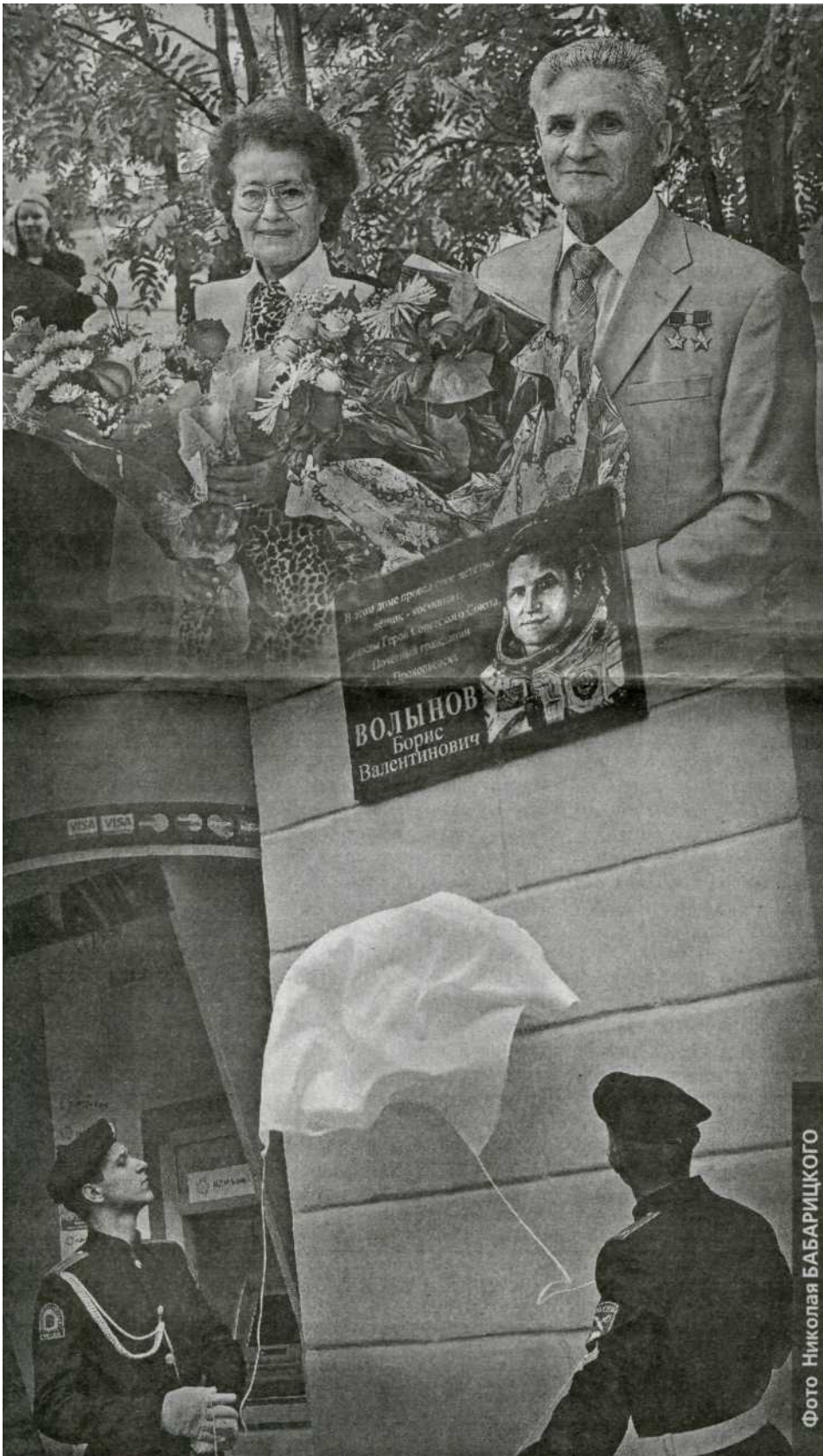
ПАРЕНЬ из нашего города 2011-й как Год космоса в России нашел свое отражение в Прокопьевске