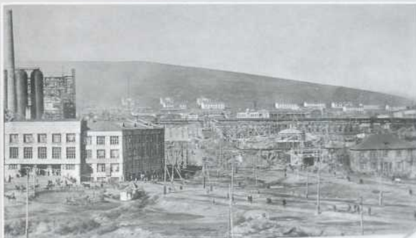
▲ Фото начала 1930-х гг.