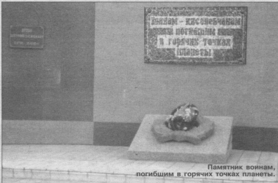
Памятник воинам, погибшим в горячих точках планеты.

тории завода был воздвигнут ОБЕЛИСК СЛАВЫ ТРУДЯЩИМСЯ ЗАВОДА "ГОРМАШ", ПАВШИМ В БОЯХ ЗА РОДИНУ . На памятнике двадцать пять имен и фамилий тех, кто не пожалел своих молодых жизней во имя Отечества.