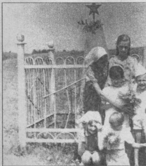
Здесь были захоронены красногвардейцы

А ведь каждый из этих памятников – как открытая книга. Он говорит свою историю – со своими событиями, героями, фактами. И мы решили к каждому из них подойти, и еще раз послушать их истории. А потом рассказать их вам. Пусть это будет не научный трактат, выстроенный педантично в четкой хронологии и в «алфавитном порядке». Это будет живой, непосредственный (насколько это возможно) разговор со временем. Мы будем неспешно гулять по городу и рассказывать вам о тех па-