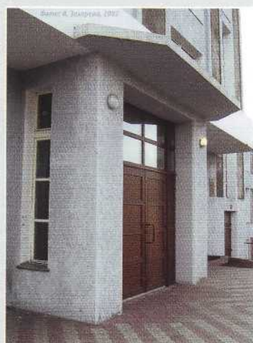
▲ Тамбур главного входа