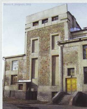
▲ На дворовых фасадах сохранилась первоначальная каменная кладка