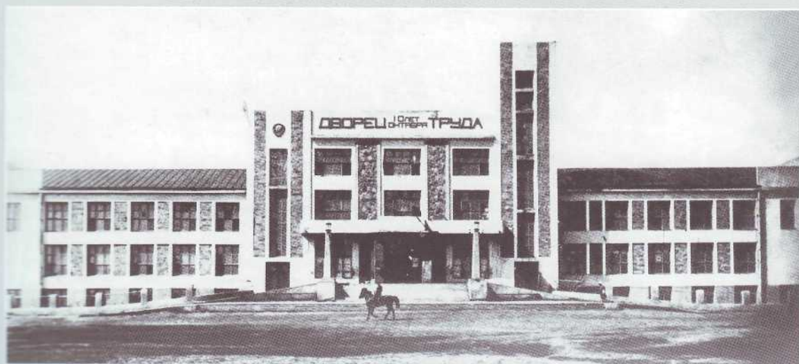
▲ Фото 1930-х гг.