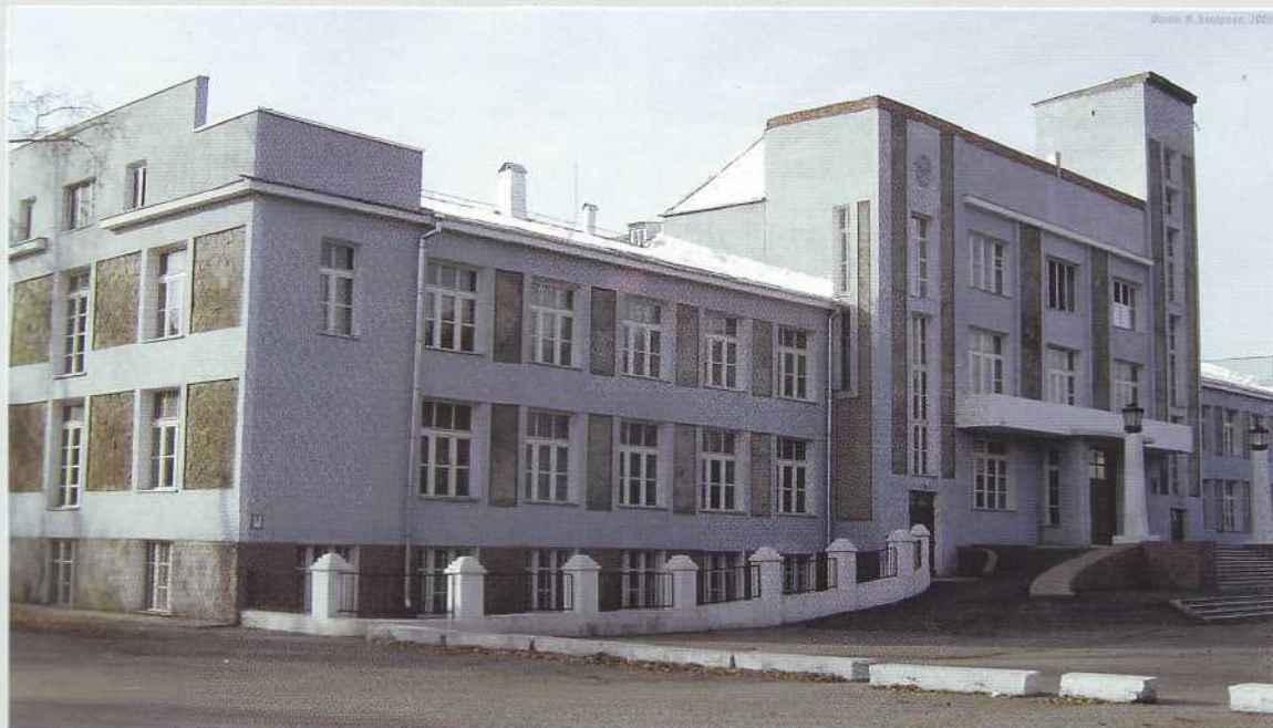
▲ Вид Дворца труда до 2005 г.