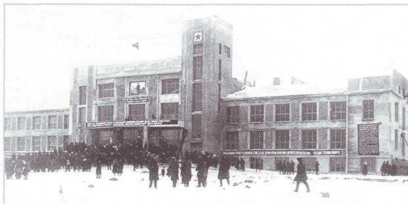
▲ Открытие Дворца труда в Щегловске 6 ноября 1927 г.

Перед зданием Дворца труда в 1957 г. был установлен обелиск на братской могиле участников гражданской войны: Буйских, Захарова, Степанова, Соколовского. Обелиск также имеет статус памятника истории местного значения.