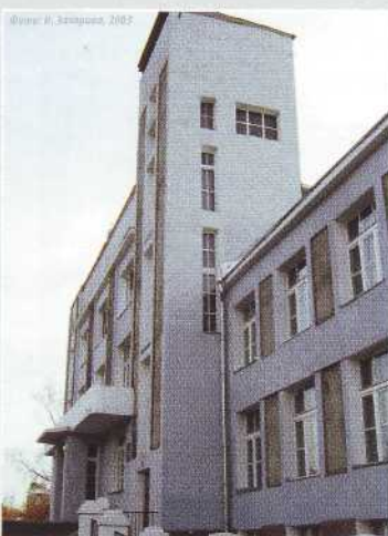
▲ Башня для часов