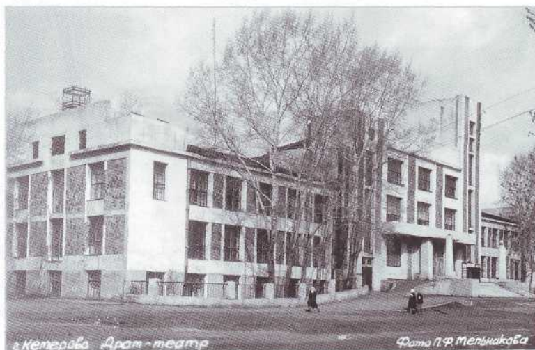
▲ С 1948 по 1960 во Дворце труда размещался драматический театр. 1950-е гг.

Здание представляет историческую и архитектурно-художественную ценность как первое крупное каменное общественное здание левобережной части Кемерово, уникальный в своем роде образец «каменного» конструктивизма.