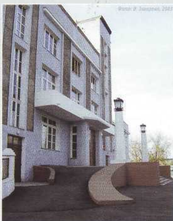
▲ Главный вход Дворца труда