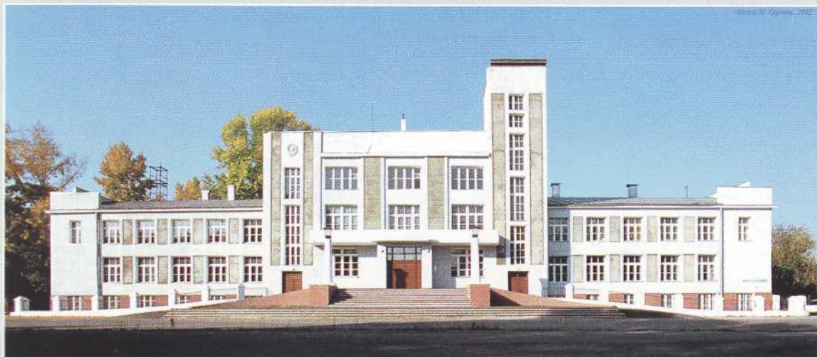
▲ А. Д. Крячков. Дворец труда. 1927