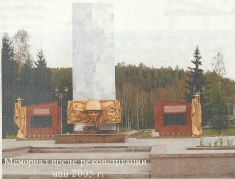
Мемориал после реконструкции май 2005 г.

- Вот это то, что нам надо! — сказал первый секретарь горкома партии при осмотре мемориала, а сопровождающая его свита безоговорочно поддержала. Художник облегченно вздохнул. Хотя комис-