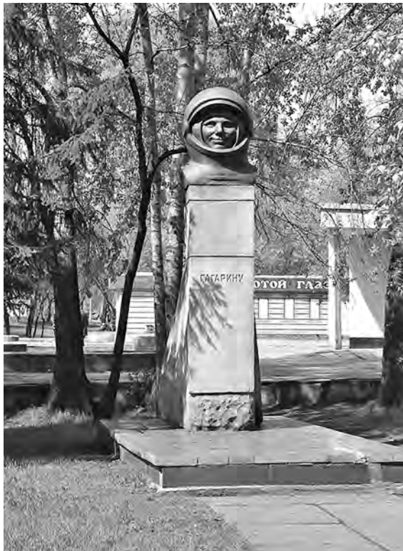
■ Гранитный памятник Гагарину в Новокузнецке соорудили скульптор Виктор Дудник и архитектор Юрий Журавков.

укладывается в наши представления о настоящем сибирском характере.