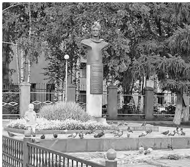
■ Бронзовый бюст Волинова был открыт в Прокопьевске на проспекте Гагарина в октябре 1984 года.

Во время первого полета состоялась первая космическая стыковка, однако приземление корабля Волинова было неудачным: спуск прошел по баллистической траектории, приземление было жестким, Волинов даже потерял передние зубы. Второй полет, на станцию «Алмаз», более известную как «Салют-5», тоже был не вполне удачным. Пребывание на станции пришлось закончить досрочно, через 47 суток полета. Почему – на этот счет есть разные версии. По одной – из-за поломки оборудования станции. По другой – из-за болезни напарника Волинова, бортинженера Виталия Жолобова. По третьей – командир и бортинженер просто разругались в пух и прах, что называется, нашла коса на камень. С тех пор космические экипажи комплектовали при участии психолога, а Волинов и его строптивый напарник больше уж в космос не летали. Впрочем, даже если это правда, вся эта история ничуть не бросает тень на кузбасского космонавта №2. Напротив, она вполне