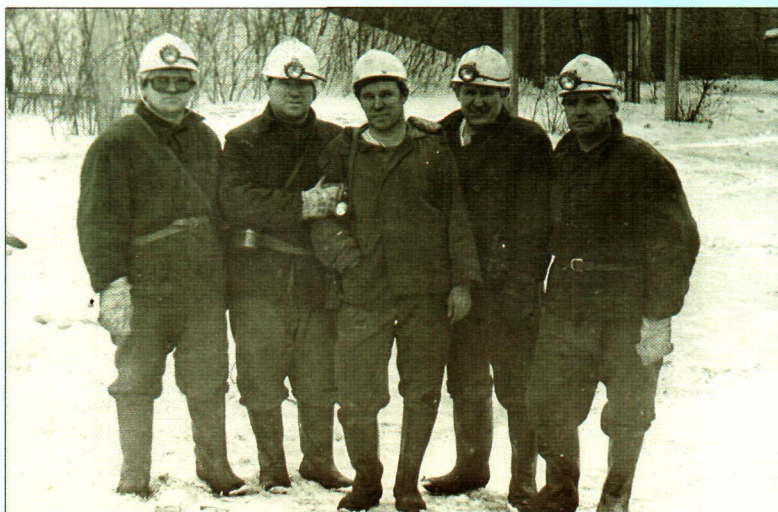
Изучение опыта организации помощи горнякам в условиях шахты. 1985 год.