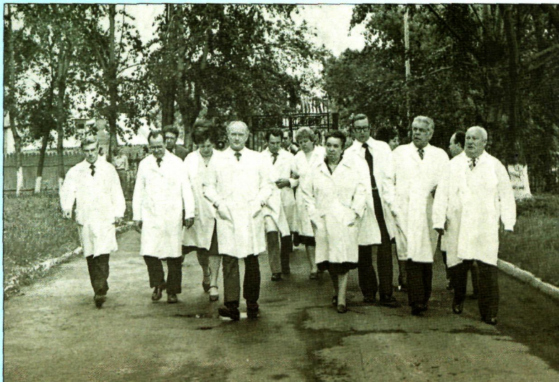
Министр здравоохранения России А.В. Трофимов (второй справа) осматривает больницу. Первый справа — главный врач К. Г. Ниренбург. 1972 год

Приказом министра здравоохранения РСФСР от 17 декабря 1977 года филиал Новосибирского НИИТО был преобразован в Кузбасский НИИ травматологии и реабилитации.