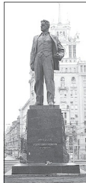
Маяковский в Москве.

Нынче страсти улеглись, но и читать Маяковского перестали. Издают биографии Лили Брик, смакуют подробности «любви втроем» и гигиенические фобии поэта, который, как леди Макбет, мыл руки каждые полчаса, строит версии вокруг самоубийства. (Впрочем, и творчество Пушкина оказалось в