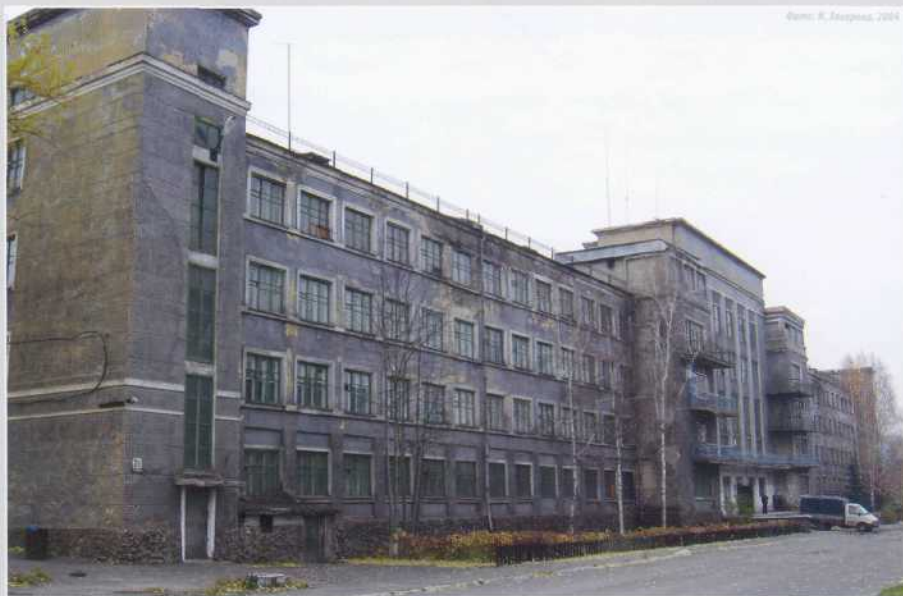
Фото: К. Захаров, 2004