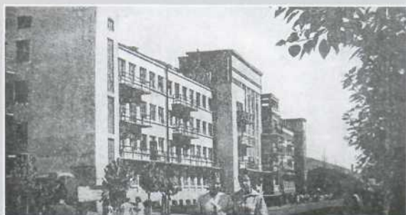
▲ Гостиница Верхней колонии, 1939. Видна асимметрия в оформлении фасадов