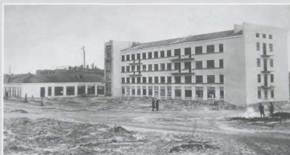
▲ Завершение первой очереди строительства, 1934