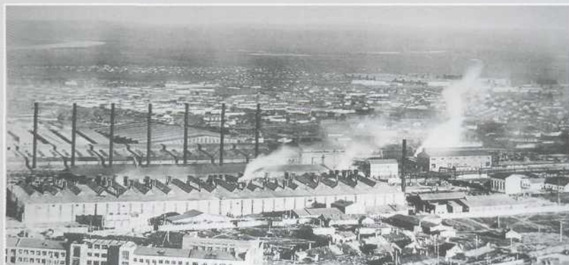
▲ Вид с горы на площадку КМК. Середина 1930-х гг. Внизу слева – недостроенное здание гостиницы Верхней колонии