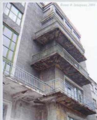
Фото: К. Захаров, 2004