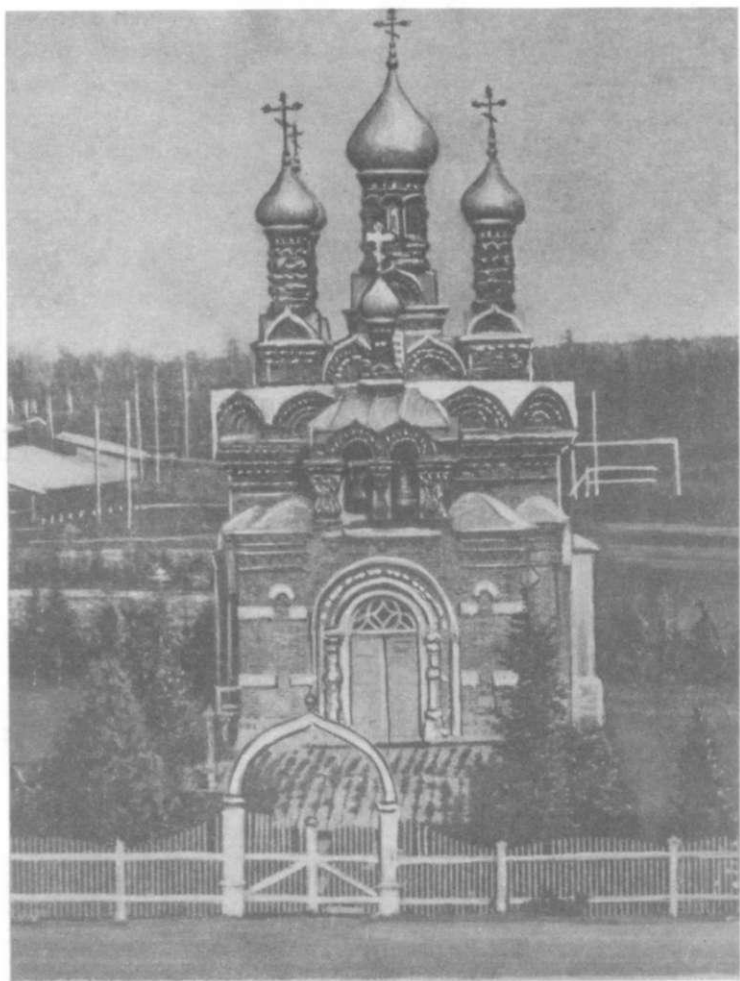
Церковь во имя Св. Андрея Критского. 1905 г.

пути были озабочены слишком медленным сооружением церквей в новых поселениях. Зимой 1896 года закончили подготовку проектов храмов в тех населенных пунктах, где имелись депо. В Тайге