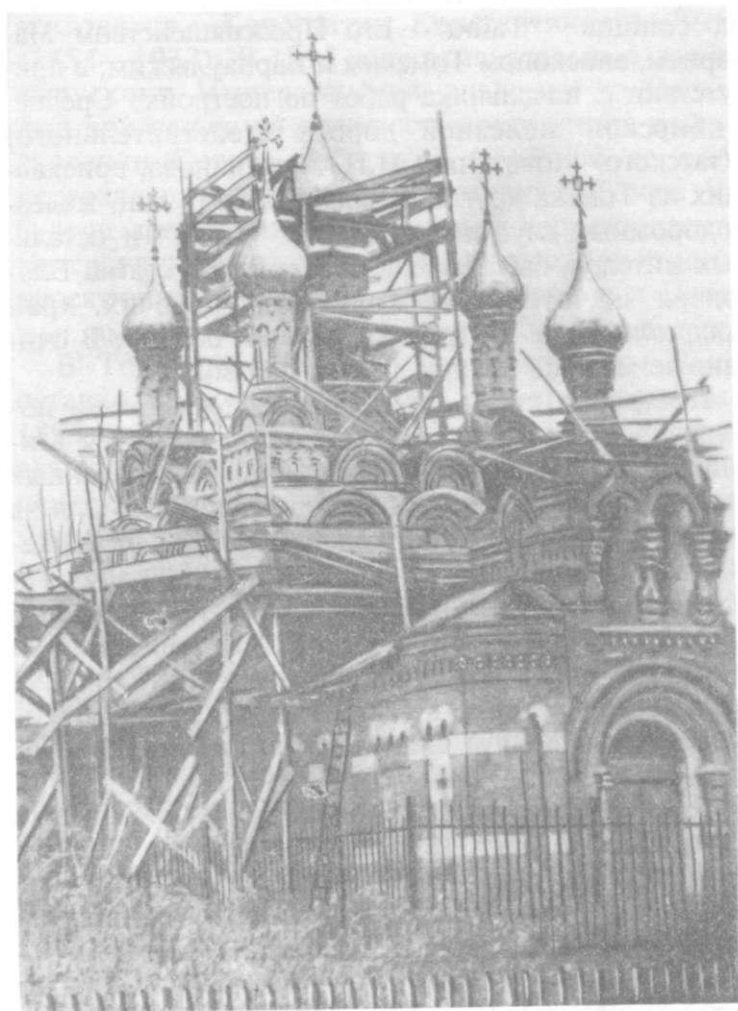
Октябрь 1995 года.