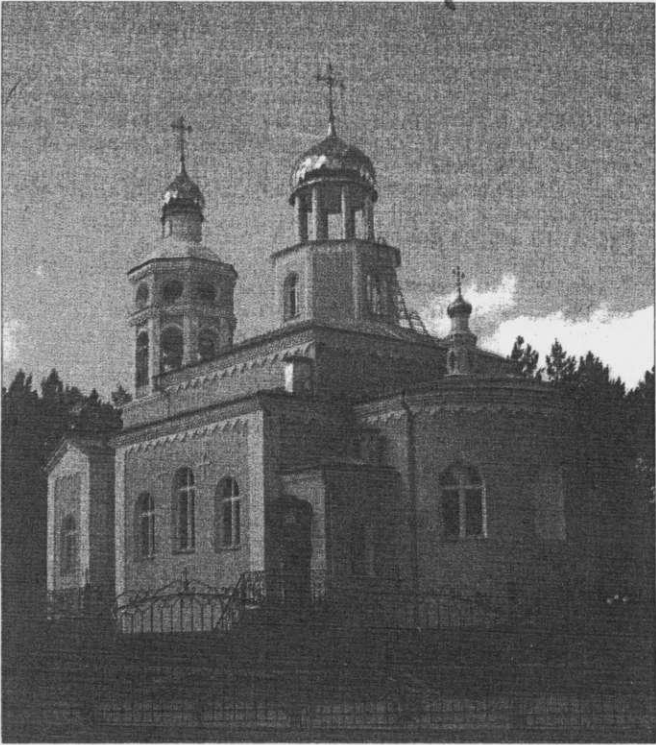
Храм в честь Святого Благоверного князя Александра Невского.