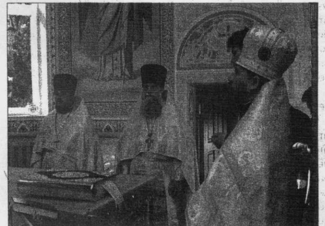
Торжественная литургия по случаю окончания строительства храма.