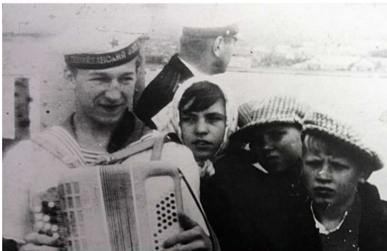
В гостях у тихоокеанцев на острове Русском.