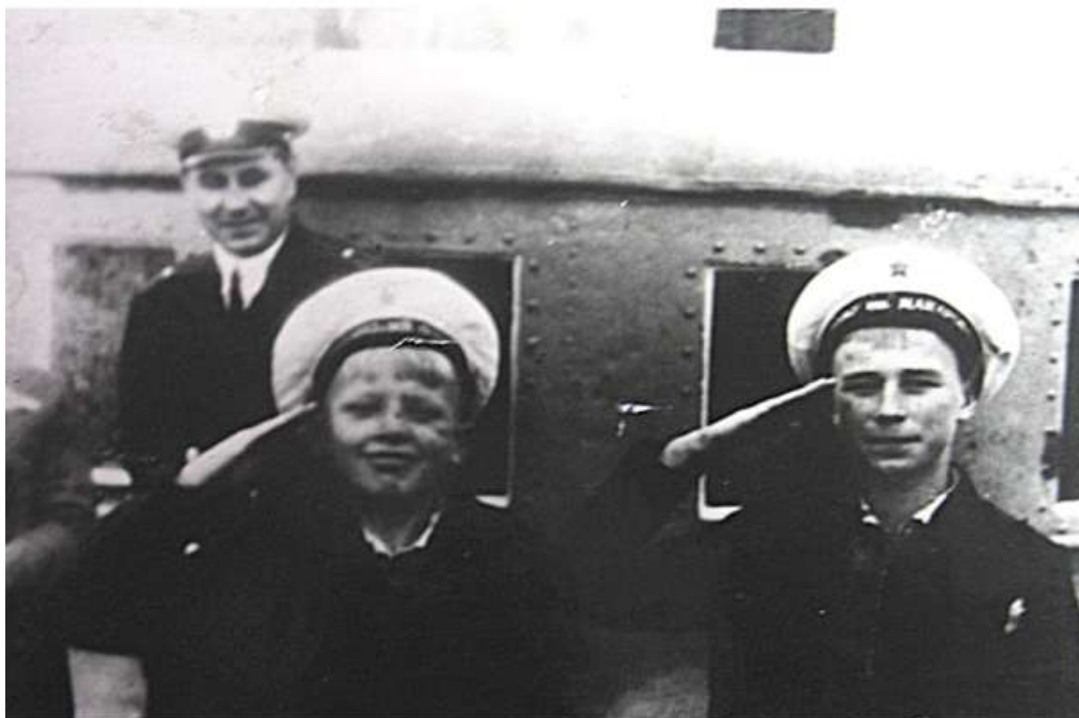
В гостях у тихоокеанцев