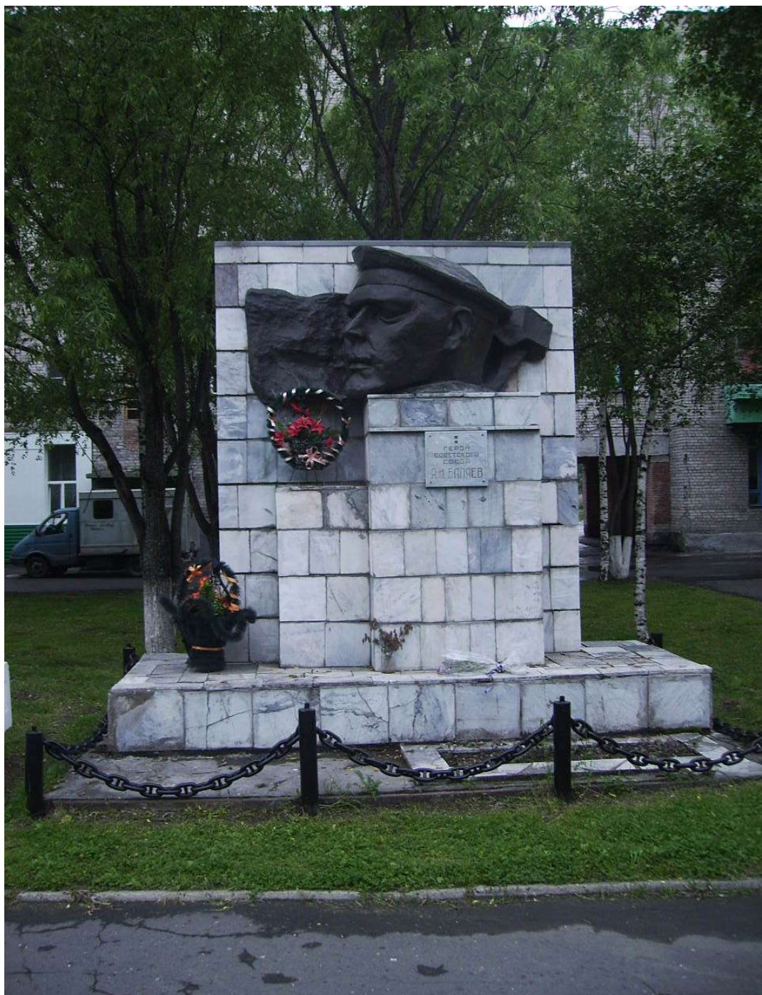
Памятник герою Советского Союза Якову Илларионовичу Баляеву в сквере на улице Поспелова