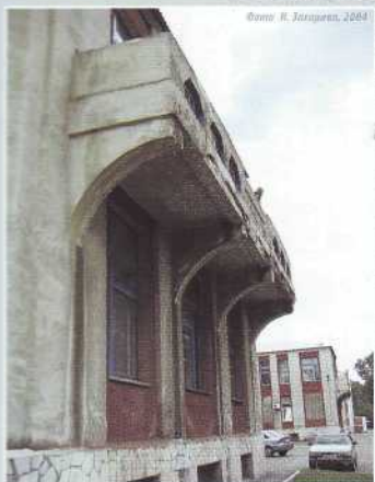
Фото © Захаров, 2004