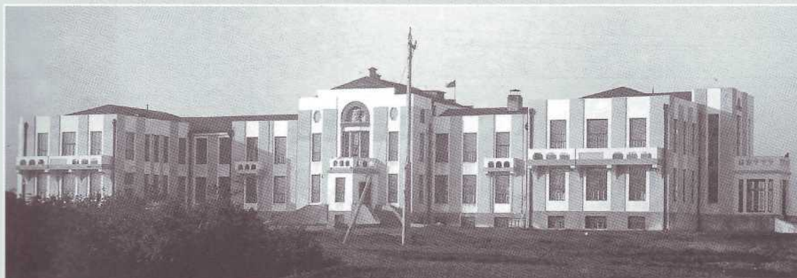
▲ А. Данилов-Шамин, А. Г. Шегенин. Окружная больница. 1927 (фото 1928 года из фандов КОКМ)