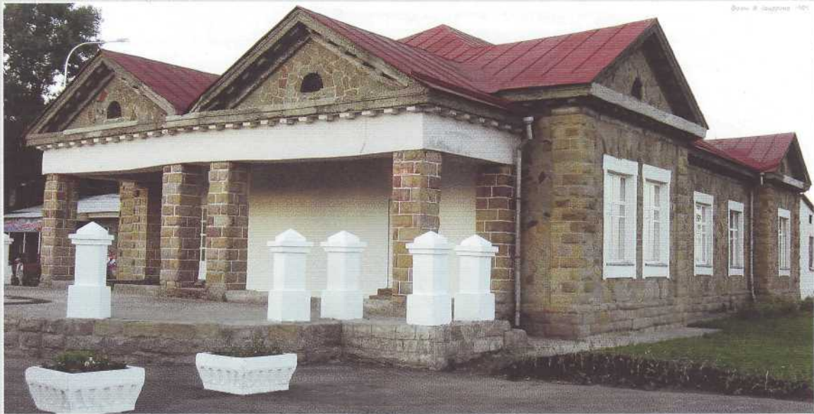
▲ Дом Рутгерса. Вид с юга