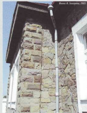
▲▲▲ Дом Рутгерса. Фрагменты фасадов

ЦБС для взрослых читателей гор. Кемерово