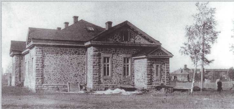
▲ Дом Рутгерса. Юго-восточный фасад, в настоящее время скрытый более поздней пристройкой (фото середины 1920-х гг. из фондов музея «Красная Горка»)