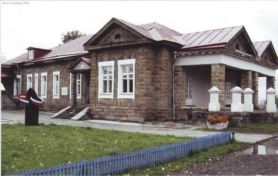
▲ Дом Рутгерса. 1916