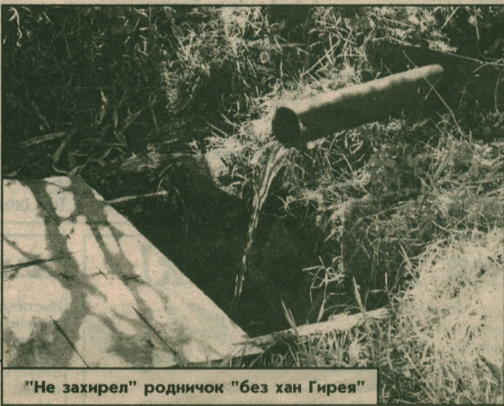
"Не захирел" родничок "без хан Гирея"