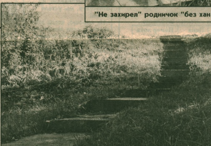
Люди с любовью проложили бетонные ступеньки к роднику