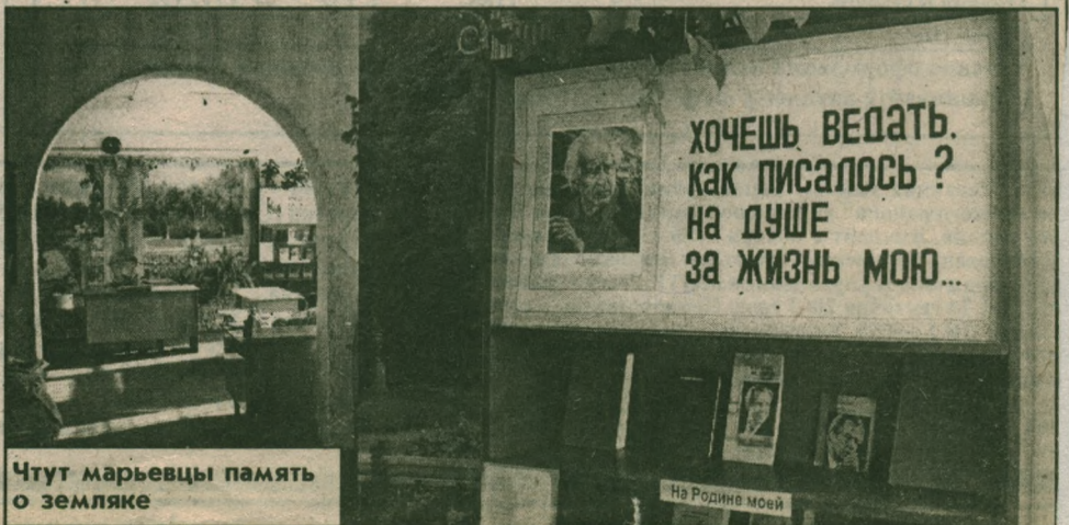
Чтут марьевцы память о земляке