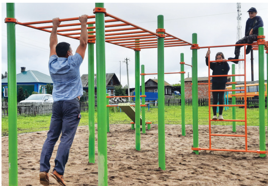
Спортивная площадка в с. Пашково, построенная в 2023 году.

Больше фотографий на сайте: яшкинскийвестник.рф