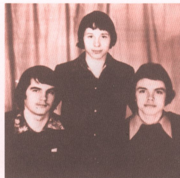
С друзьями (в центре)

— Не зажили раны, не улеглось родительское горе, но мы знаем, что