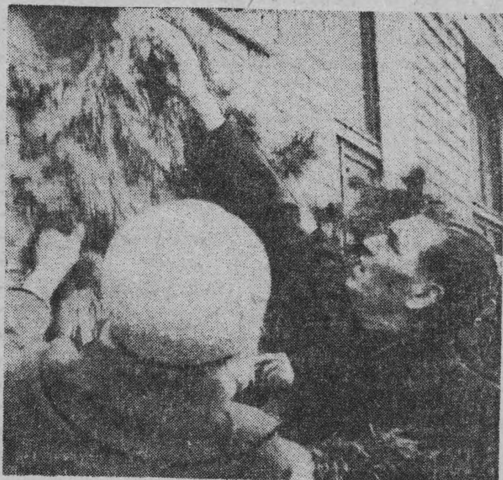
Цветы — боевым друзьям...