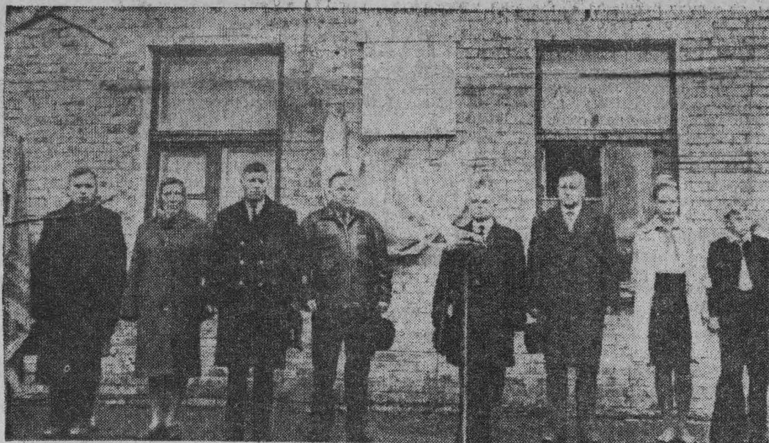
Почетный караул бывших аэроклубовцев у огня славы.

Да, этот факт — одна из ярких страниц истории аэроклуба. Они, его курсанты и командиры, уходили на фронт добровольцами с первых дней войны. А в 1942 году ушел последний выпуск пилотов, и оставшиеся еще в городе их наставники. Помните, как у Николая Осровского — «Райком закрыт. Все ушли на фронт». Так было в гражданскую, так повторилось в Отечественную: патриотизм — фамильная черта советских людей. И так же беззаветно дрались за свою Родину новое поколение корчагиных — комсомольцы сороковых годов. «Пусть вечно живут в памяти земляков, — написано на мемориальной доске, — имена тех, кто отдал свою жизнь за наше счастье». Их семнадцать, этих имен погибших героев. И каждое свято, дорого прокопчанам.