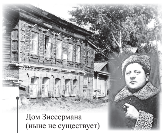
Дом Зиссермана (ныне не существует)

полагались ряд артелей, обувная мастерская комбината бытового обслуживания, мастерская местного художника.