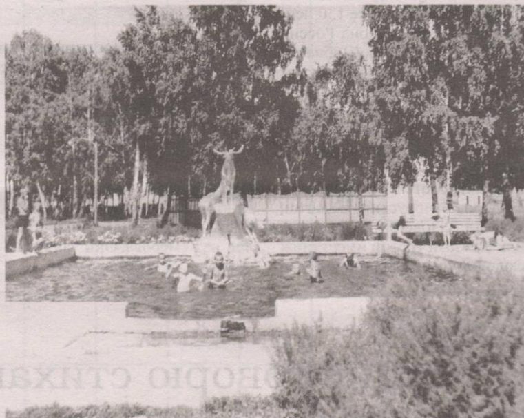
В саду ДК спирткомбината был летний бассейн. За бассейном - летняя танцплощадка

«ОБРАТНЫЙ БИЛЕТ» - проект литературно-мемориального музея В.А. Чивилихина, посвященный 160-летию Мариинска.