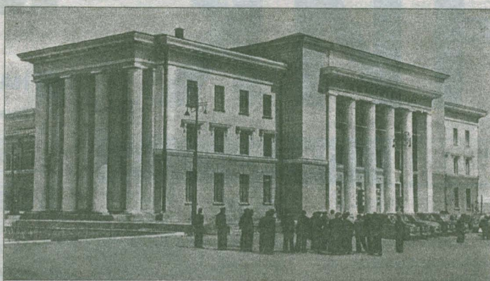
Делегация донецких горняков осматривает Дом культуры шахты имени Сталина в Прокопьевске

Кузбасс и Донбасс связывает богатая история — в свое время стали побратимами шахты Прокопьевская и Горловская.