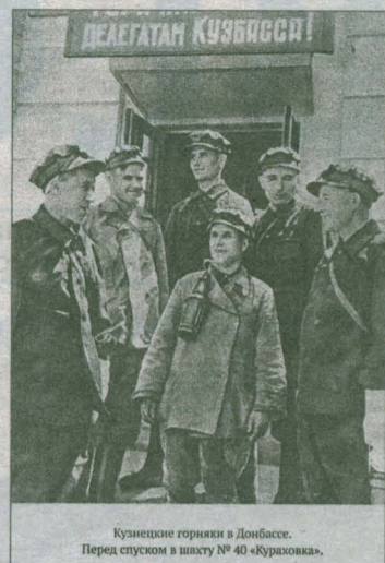
Кузнецкие горняки в Донбассе. Перед спуском в шахту №40 «Курдюковка».

Вот и сейчас Кузбасс готов подставить плечо Горловке — кузбасские специалисты готовят предложения по восстановлению промышленности, содействию в восстановлении нормального рабочего ритма