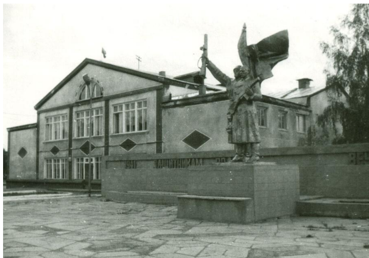
Первоначальный вид памятника